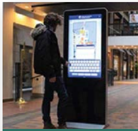
Ecran d'accueil DAB

Les médecins et professionnels de santé ont des tablettes permettant une grande mobilité tout en gardant sous la main tous les dossiers de leurs patients. Il n'est maintenant plus nécessaire de bloquer l'indispensable tablette, le technicien prendra la main sur le terminal alors que le médecin continuera ses consultations